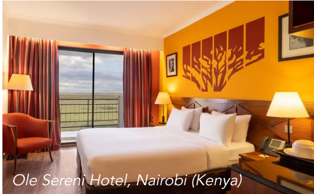
Ole Sereni Hotel, Nairobi (Kenya)

Abbiamo diverse scelte tra i principali campi tendati del Mara per provare l'esperienza di dormire in tenda ma in condizioni lussuose! I campi hanno tende per l'alloggio, zona pranzo e bar. Le tende sono costruite su base di cemento o piattaforma in legno; sotto il tetto di paglia o doppio tetto in tela. Sono tutte fornite di bagni privati con WC con scarico normale, docce provviste di acqua calda e fredda. Le strutture in alcuni campi includono anche una piscina.