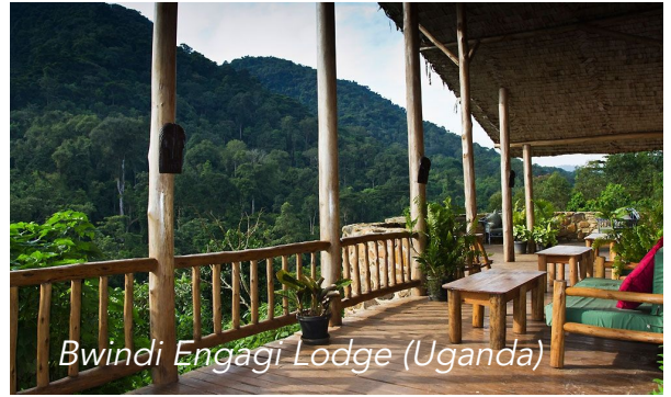
Bwindi Engagi Lodge (Uganda)