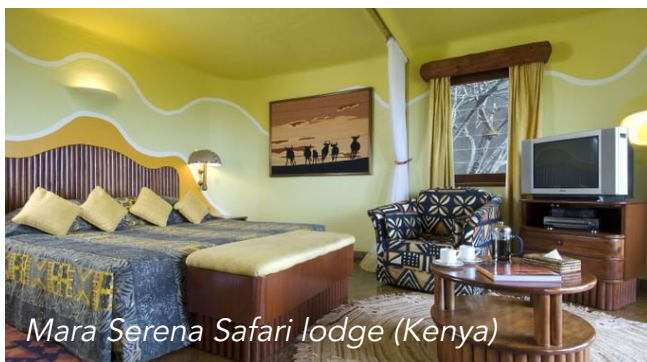
Mara Serena Safari Lodge (Kenya)