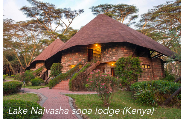
Lake Naivasha Sopa Lodge (Kenya)